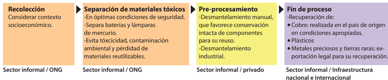
Figura 1. Integración de los sectores formal e informal para el manejo de REE. 6,7

La primera divide los residuos en tres tipos: Sólidos Urbanos, Peligrosos y de Manejo Especial. Los REE son parte de los residuos de manejo especial (artículo 19 sección VIII de esta ley) y se describen como residuos tecnológicos provenientes de las industrias de la informática que al transcurrir su vida útil requieren de un manejo específico. El manejo de residuos de manejo especial es responsabilidad de las fuentes que los generan. Asimismo, las autoridades ambientales de entidades federativas y municipios son responsables de controlar a las grandes generadoras de estos residuos. 22,23